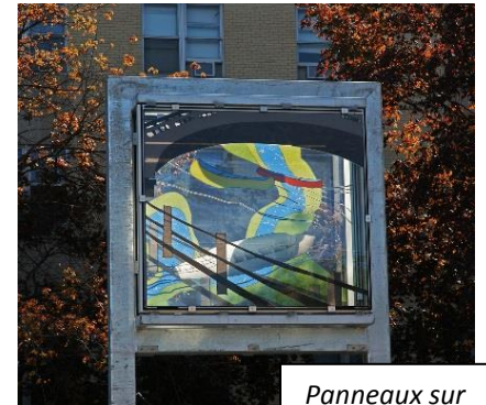
Panneaux sur le thème du canal

La tour du centre, qui évoque les terres, présente un sentier bordé d'arbres sur son panneau extérieur. Il contraste avec le damier de champs verts illustré sur le panneau du centre, clin d'œil à l'héritage agricole de la ville. Le dernier panneau, du côté est, reproduit une vue aérienne de rues résidentielles ponctuées d'arbres, un paysage typique du Vieil Ottawa-Est. La nuit, le pourtour des panneaux en verre sera illuminé par des DEL.