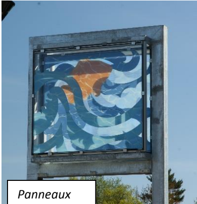
Panneaux sur le thème de la rivière

À l'extrémité opposée, les panneaux sur le thème du canal reproduisent la partie inférieure du pont Pretoria et, sous celui-ci, les poteaux en béton et les garde-fous en acier qui courent le long du canal dans toute la ville. Au-delà de ces structures se profilent un bateau d'excursion blanc et quelques canots. Du côté est de l'œuvre, figure une carte stylisée du canal illustrant également le lac Dow.