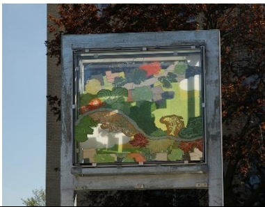
Panneaux sur le thème des terres

La tour du centre, qui évoque les terres, présente un sentier bordé d'arbres sur son panneau extérieur. Il contraste avec le damier de champs verts illustré sur le panneau du centre, clin d'œil à l'héritage agricole de la ville. Le dernier panneau, du côté est, reproduit une vue aérienne de rues résidentielles ponctuées d'arbres, un paysage typique du Vieil Ottawa-Est. La nuit, le pourtour des panneaux en verre sera illuminé par des DEL.